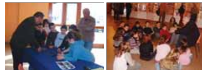
Les enfants ont posé beaucoup de questions.