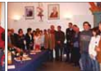
Personnel et représentants des services publics