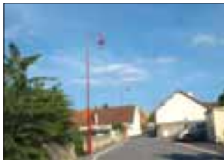
Rue du Tilleul

Suppression des points noirs du paysage en procédant progressivement à l'enfouissement des réseaux, suivi de la pose de candélabres et de la réfection des voiries et des trottoirs.