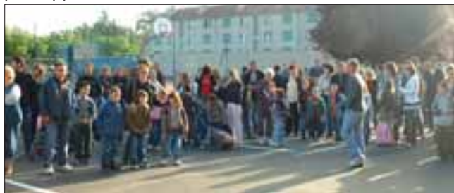
En attendant l'appel

Cette année, 165 élèves ont effectué leur rentrée à l'école de Saint-Victor, soit un effectif en hausse de 11 élèves par rapport à 2006.