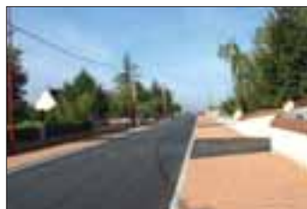
Quelques mois après