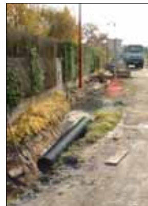
Réseau d'eaux pluviales en cours rue des Roses

Avant d'engager la réfection de la voirie et des trottoirs dans ce secteur, il s'est avéré nécessaire d'effectuer un diagnostic de l'état du réseau d'eaux pluviales. L'opération de télé inspection des canalisations a fait apparaître des