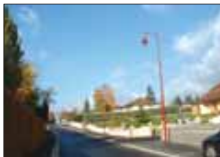
Rue des Chataigners