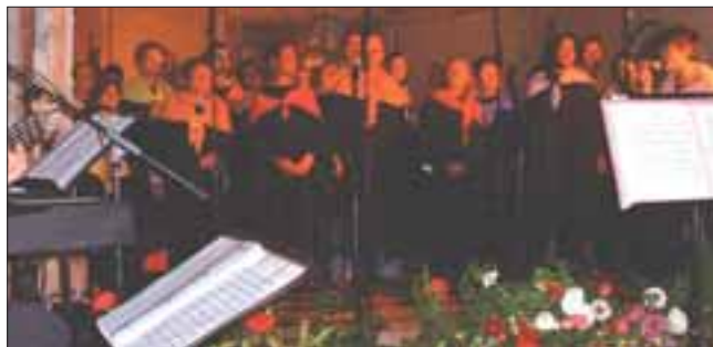
GOSPEL AU CŒUR en concert le 23 septembre 2007

Les membres d'ARESVI vous prient d'accepter leurs meilleurs vœux pour cette nouvelle année.