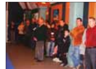
Nouveaux habitants et associations

Chaque année, la Municipalité présente ses vœux aux personnel de Mairie, aux représentants des services publics partenaires, aux Associations, aux nouveaux habitants et aux annonceurs du bulletin municipal, ce sont aussi autant de moments d'échanges et de convivialité très appréciés.