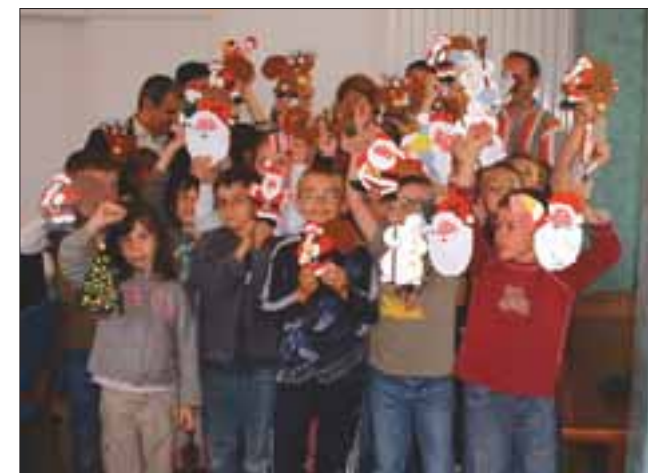
Les écoliers décorent la commune.