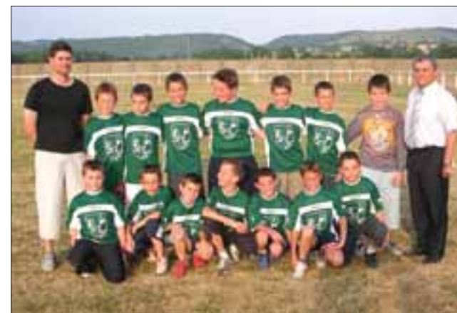
Remise de maillots