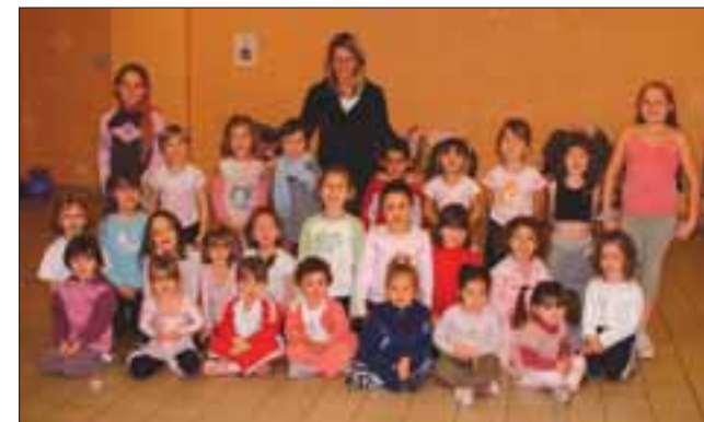
Groupe des 3 à 7 ans

ENFANTS de 3 à 7 ans : le mercredi de 10H à 11H : découvrir le plaisir de se déplacer ensemble jeux ludiques et éducatifs