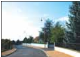
Rue des noyers

Suppression des points noirs du paysage en procédant progressivement à l'enfouissement des réseaux, suivi de la pose de candélabres et de la réfection des voiries et des trottoirs.