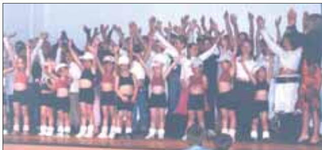
Gala de fin d'année

L'année 2006 s'est clôturée par une fête de fin de saison qui a remportée un vif succès, durant laquelle se sont succédées, des plus petites (3 ans) jusqu'aux seniors (88 ans) en passant par les ados et les adultes, diverses chorégraphies sur des rythmes et musiques variés.