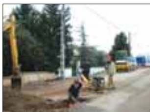
La rue en travaux